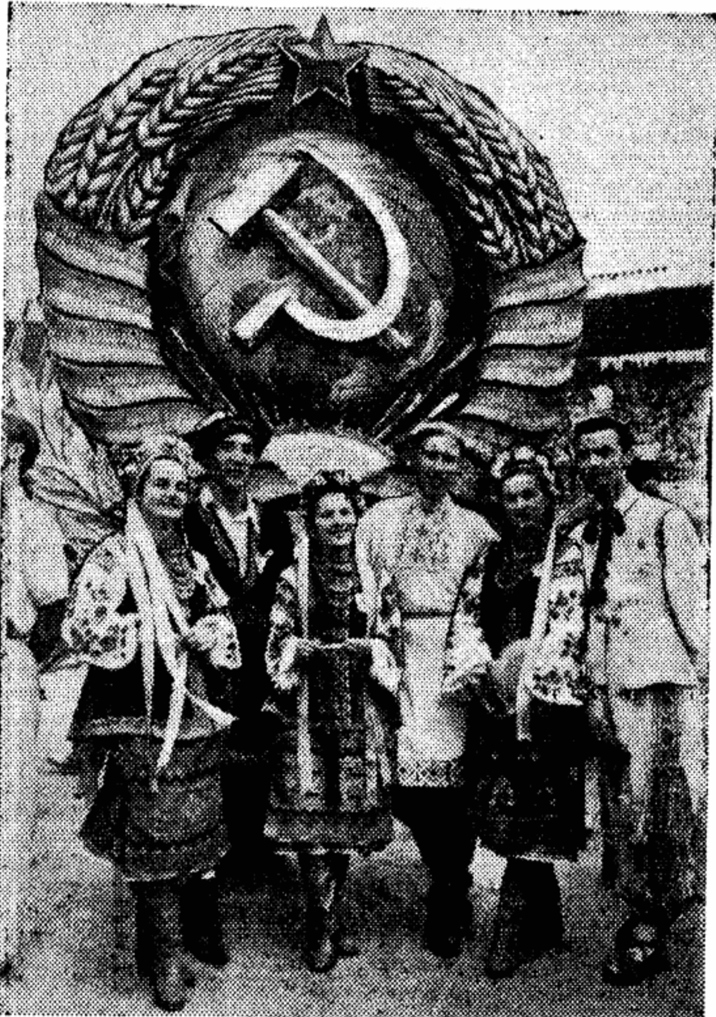
Словно зерна в колосьях, обрамляющих Герб Советского Союза, в плотном строю стоят юноши и девушки — гостеприимные хозяева огромного дома Всемирного фестиваля, члены советской делегации.