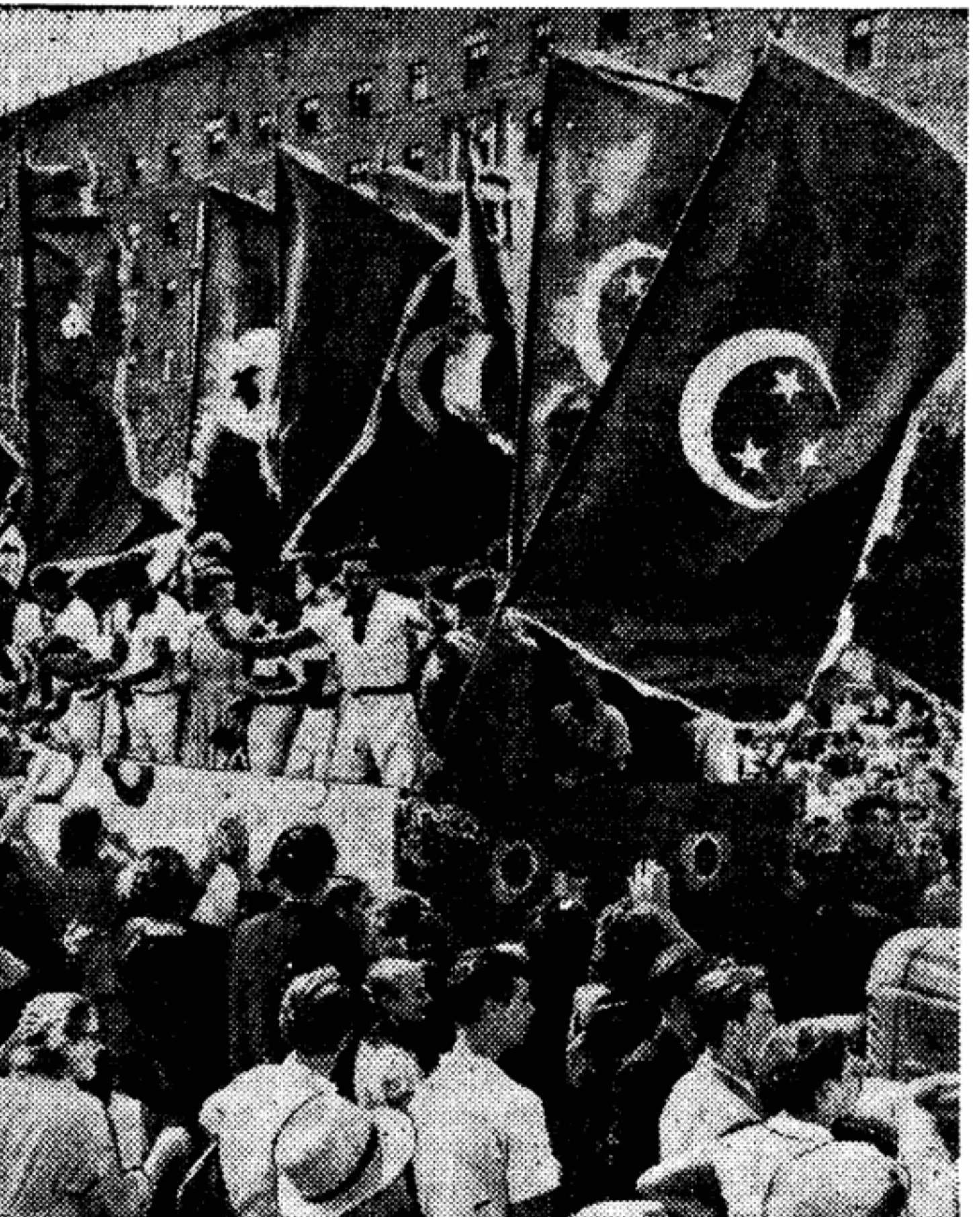
Молодых египтян встречали особенно тепло — у всех в памяти свежи те недавние дни, когда народ Египта мужественно боролся за независимость своей страны.