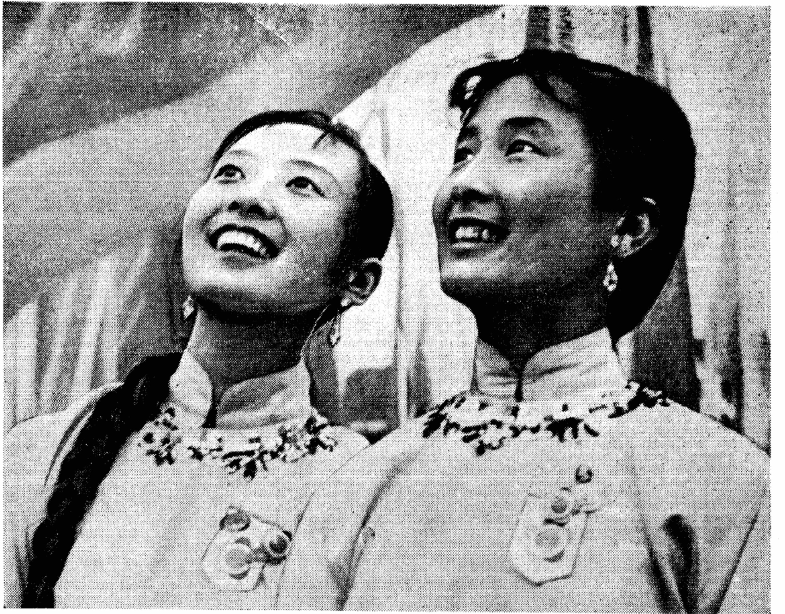
Летят голуби мира!