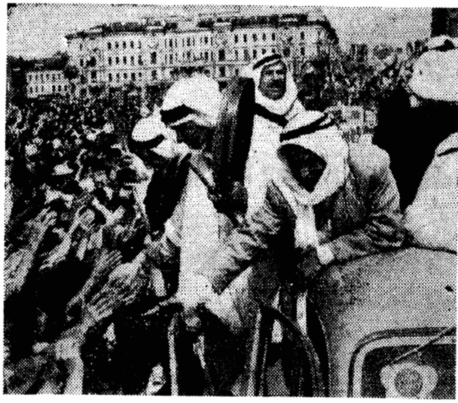
И опять машине не пробиться сквозь приветственный строй москвичей, зашуривших «трассу Счастья». И вот в сотый, нет, в тысячный раз делегаты Иордании спешат поздравить протянув к ним со всех сторон руки новых друзей.