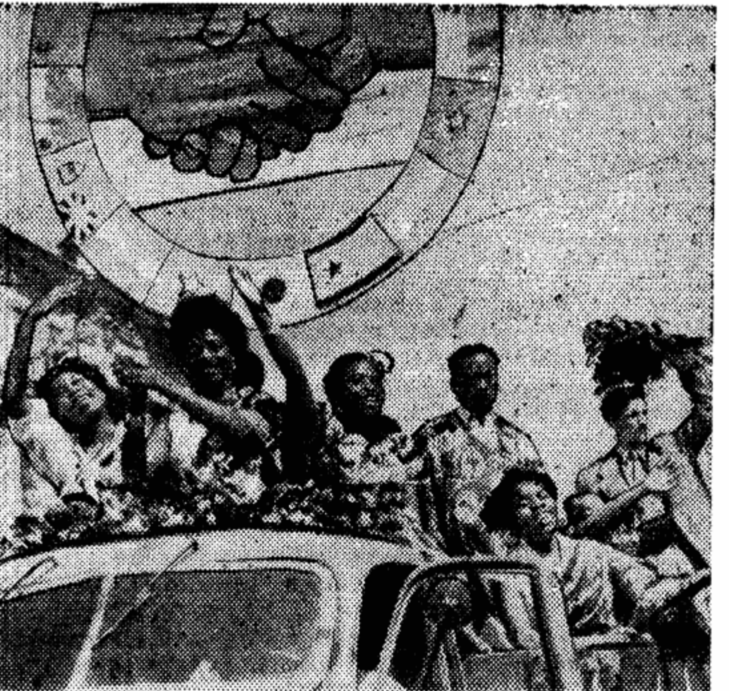
Вот они, делегаты Черной Африки! Восторженные лица, блеск белозубых улыбок, радостные приветственные жесты... Москва не забудет этой первой встречи с вами, юноши и девушки пробуждающегося континента!