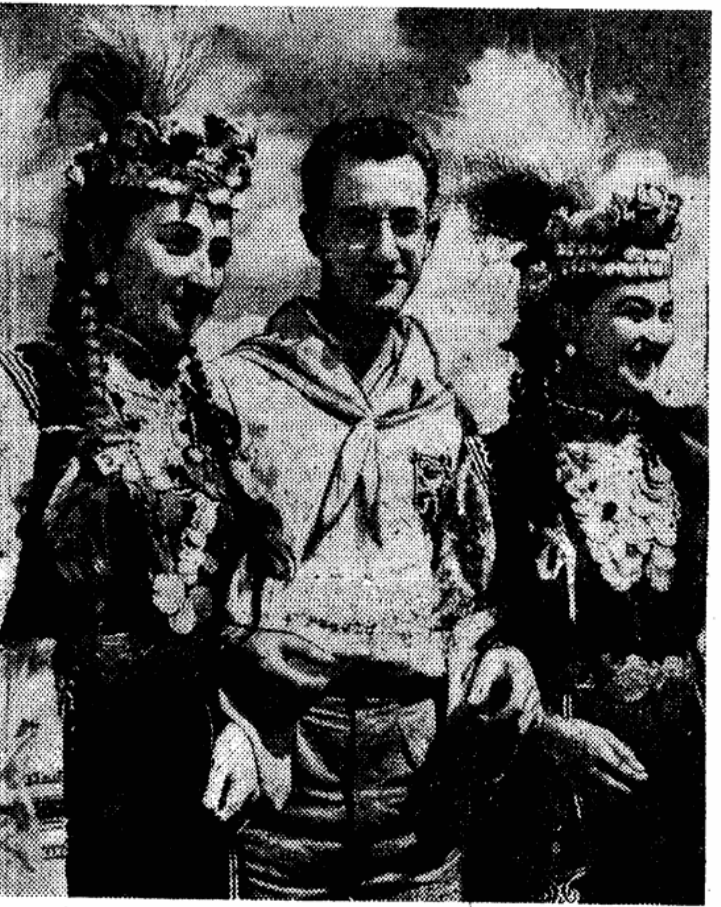
Полубуйтесь, как хороши национальные болгарские костюмы у деушек! А эти лица — молодые, счастливые, веселые лица деушек из Болгарии и юноши из Бельгии — и того лучше!

Какое ослепительное восхищение вызывало на стадионе эта живая исполненная скорочетания! Но вот последнее гимнастическое упражнение, и то, что мы давно уже видели сперва на зимних пальто, потом на отворотных демисезонных, затем в петличках летних костюмов и, наконец, на флагах праздничной Москвы, — пятицветная эмблема праздника, сейчас, приобретает невиданные размеры, раскинувшись над полем стадиона. А на склоне Восточной трибуны, где сидели тысячи спортсменов, в эту минуту возникли, как по волшебству, громадные синие буквы, из которых сложилось слово «Дружба»... И снова повторяли тысячи голосов на трибунах: «Дружба! Дружба! Дружба!» И, как никогда, казался в этот же вечерний, но еще по-летнему светлый час прекрасный и молодой мир, и, как никогда, сердца десятков тысяч людей, присутствовавших на стадионе, наполнились сердцем во всех концах мира, куда доносились по радио слова о празднике. Наполнились ясней уверенностью в том, что добрая молодая воля непобедима и огромна, прекрасный солнечный мир сумеет отстоять свое счастье, свое будущее. Лев КАСИЛЬ